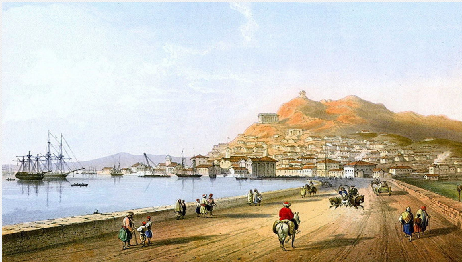
Карло Боссоли «Керчь со стороны Ени-Кале»

К концу 1783 года в Крыму по "Греческому проекту" появились такие названия городов, как Севастополь, Симферополь, были возвращены древнегреческие имена Феодосии и Евпатории. Развернулось масштабное строительство. За счет казны возводились здания общественного назначения. Крымчанам выдавали ссуды на строительство собственных домов. Население молодого российского региона стремительно росло.