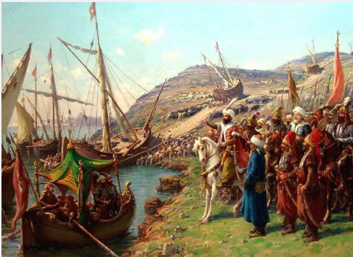
Завоевание Крыма татарами. 1475 год

В 1475 турки вторглись на территорию Крыма и покончили с генуэзским владычеством на море, уничтожив православное княжество Феодоро. Ограничили независимость Крымского ханства, сделав его вассалом турецкого султана. Турки продолжали нападать на территорию Руси, занимаясь работорговлей.