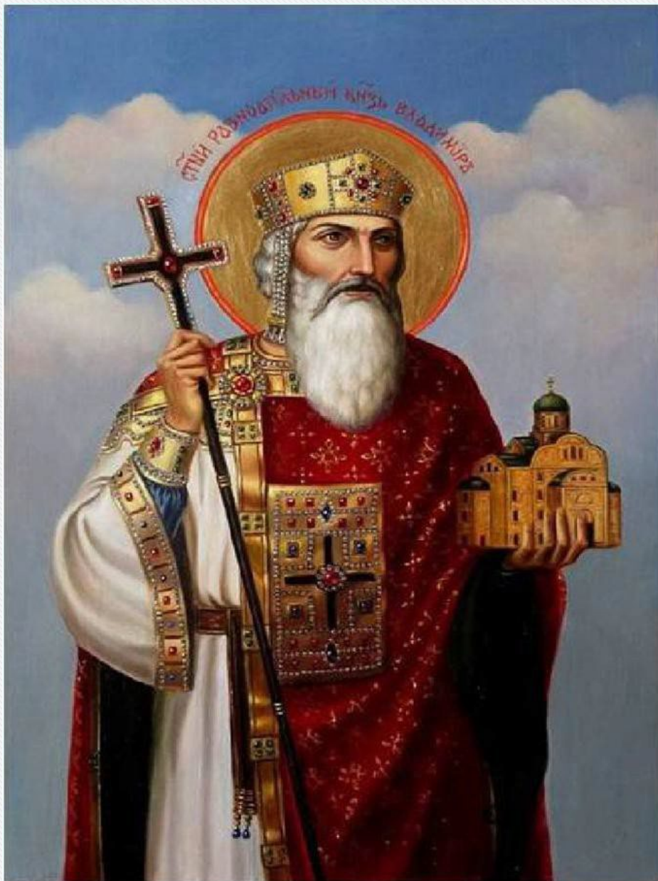
Святой равноапостольный князь Владимир

В 988 году князь Владимир овладел византийским Херсонесом.