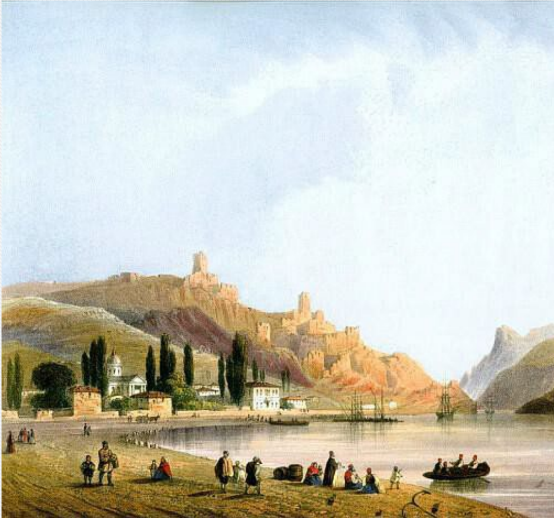
Карло Боссоли «Вид Балаклавы»

Присоединив Крым, Россия обезопасила свои южные границы, а так же решила задачи по защите многочисленного христианского населения в бывших владениях Крымского ханства, которое было ущемлено в гражданских правах. Крымские армяне, греки, грузины получили все возможности для самореализации в различных сферах деятельности.