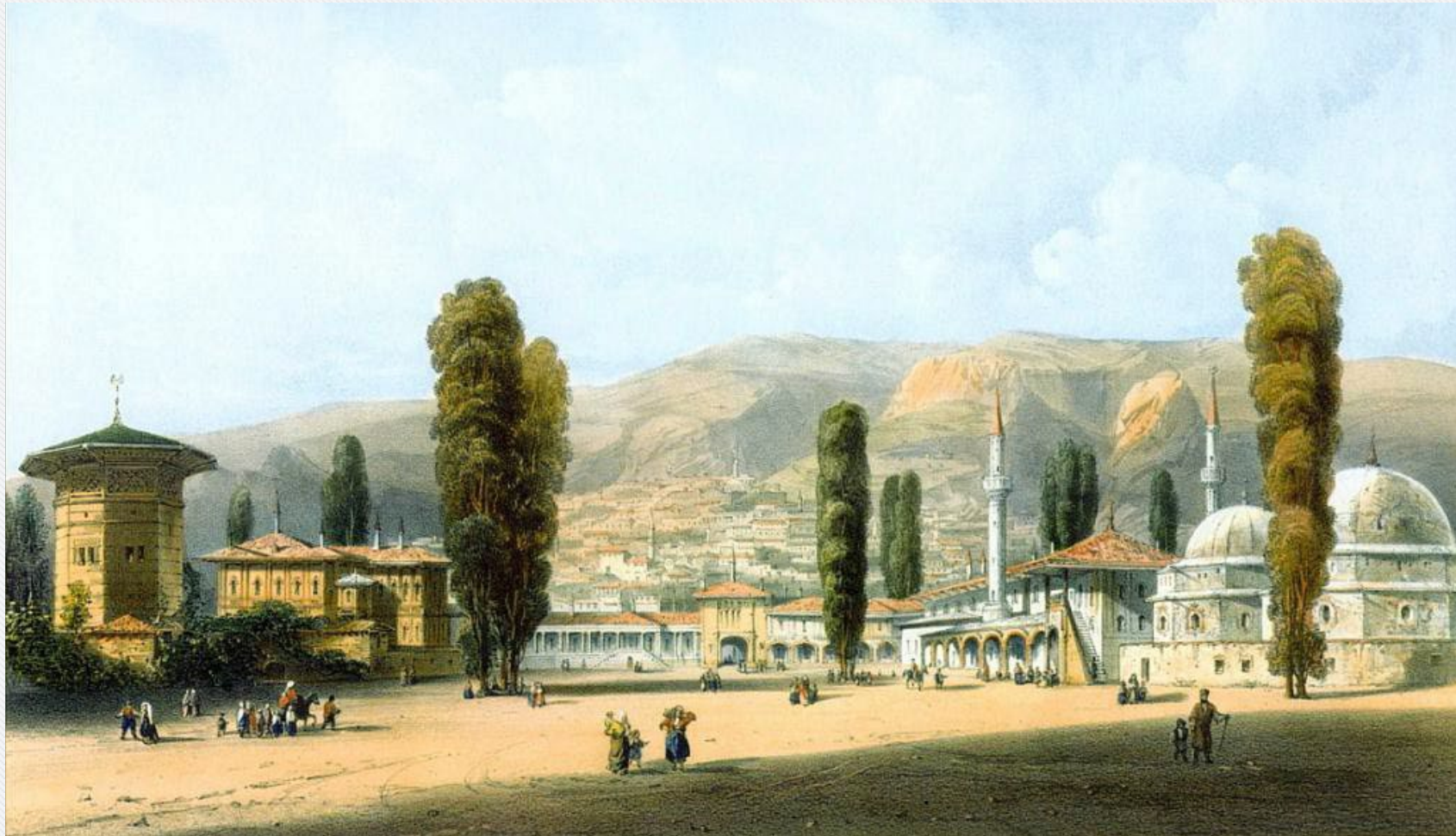
Карло Боссоли «Ханский дворец. 1840-1842»

С приходом русской администрации в 1783 г. в Крыму была ликвидирована работорговя, стало развиваться государственное управление европейского типа. Правительство переселило сюда из центральных и украинских губерний государственных крестьян. Знатные беи были уравнены в правах с российским дворянством. Усилиями Г. А. Потёмкина из Англии и Франции были выписаны специалисты для устройства садов и парков.