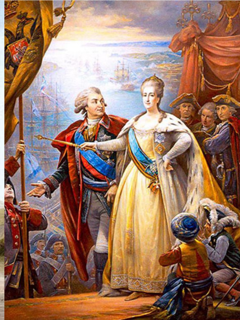
Григорий Потемкин-Таврический и Екатерина Великая