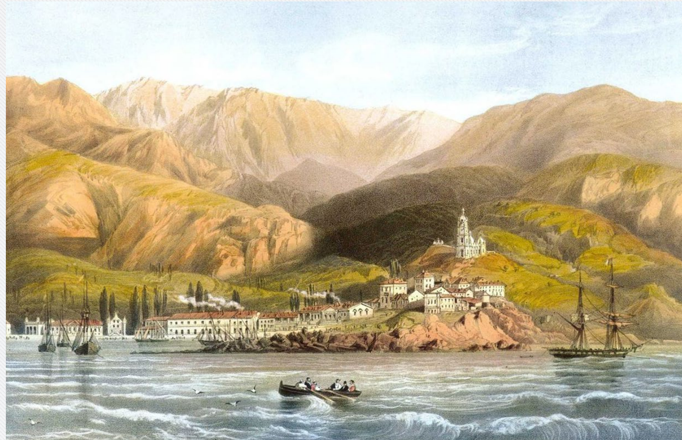
Карло Боссоли «Вид Ялты»

Помимо полуострова Крым, в состав Российской империи были включены и владения Крымского ханства на Кавказе – Тамань и Кубань. На Кубани присоединение к Российской империи также прошло мирно, в торжественной обстановке. На верность Российской империи присягнули две крупнейшие ногайские орды – Едиганская и Джамбулукская, кочевавшие в степях Причерноморья.