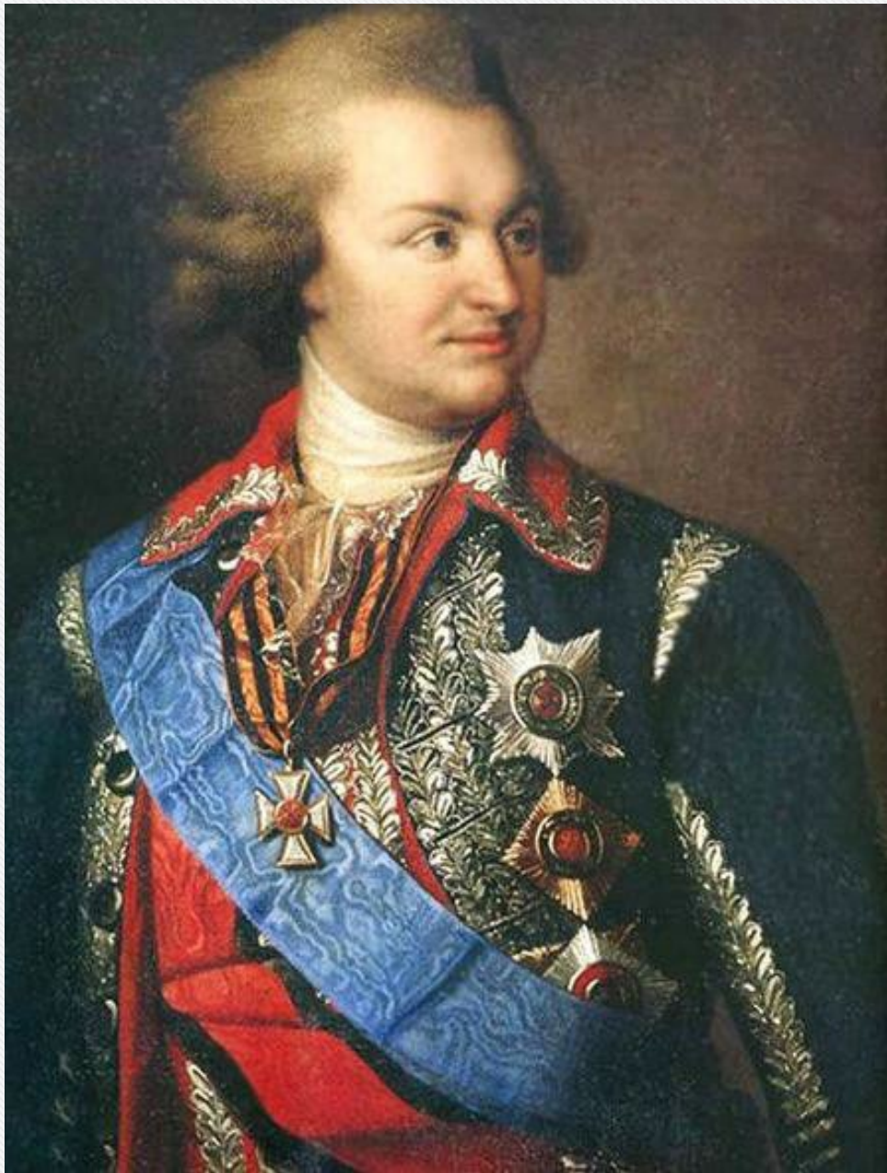
Григорий Александрович Потёмкин

Задача обеспечения безопасности южных границ России и освоение вновь приобретённых земель была поручена императрицей Г. А. Потёмкину. Ввиду настроений и беспорядков в Крыму, Потёмкин обратился с меморандумом к императрице Екатерине II. В нём он обосновывал необходимость включения Крымского полуострова в состав России, ссылаясь на пример европейских колониальных держав, делящих Азию, Африку и Америку.