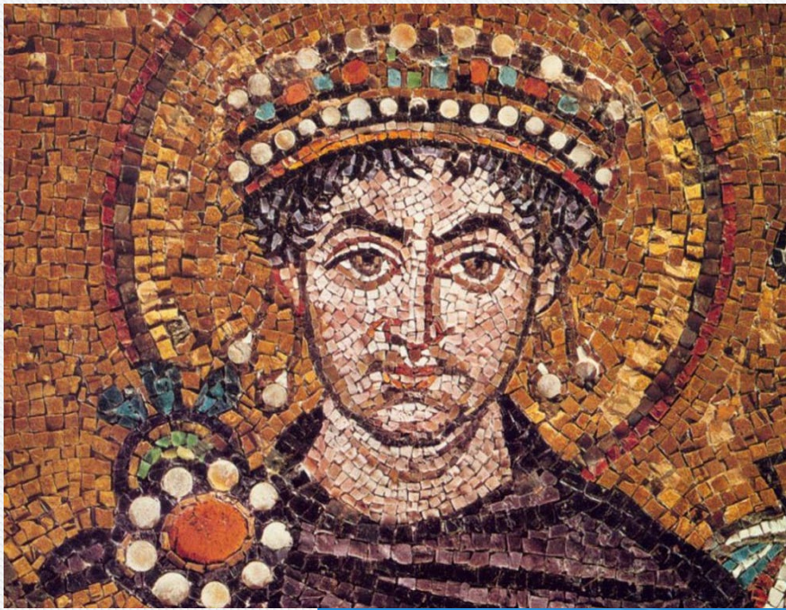
Мозаичный портрет Юстиниана I

Руины древнего Херсонеса. V век до н. э.